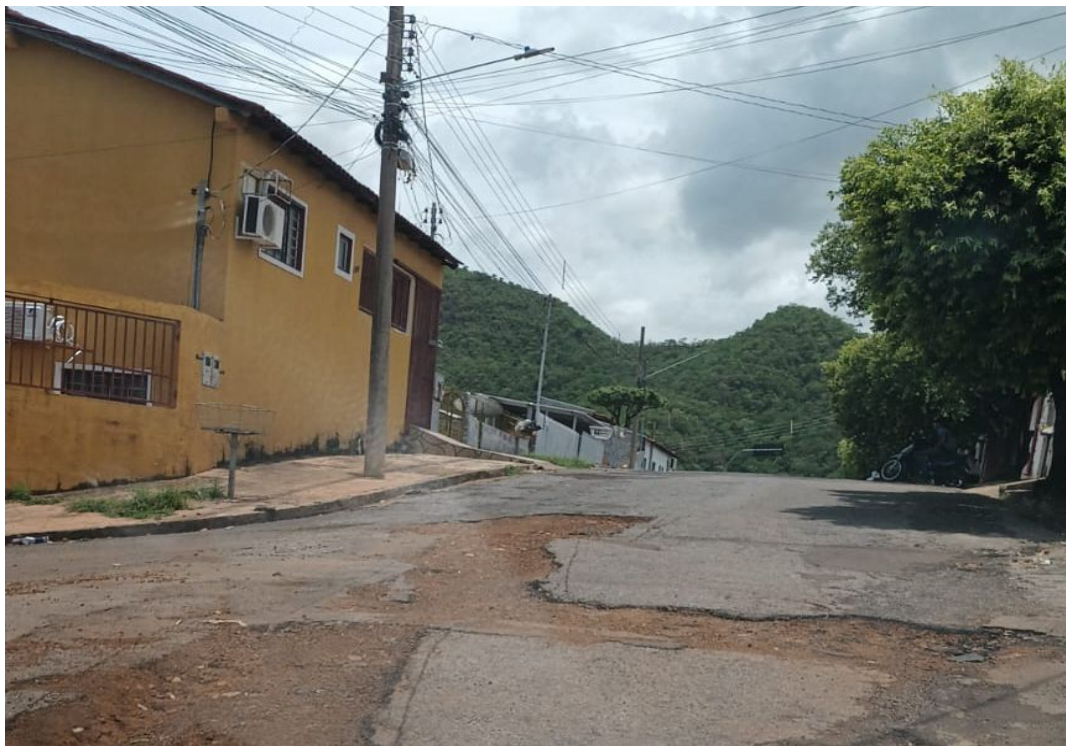
Anexo III: Localização segundo google maps - Rua Brasília, Bairro Sena Marques